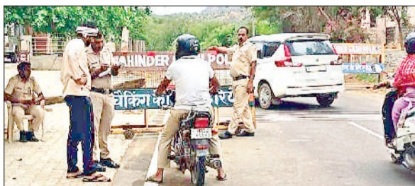
नारनौल। बाइक का चालान करती पुलिस।