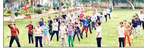
नारनौल। शिविर में भाग लेती छात्राएं।