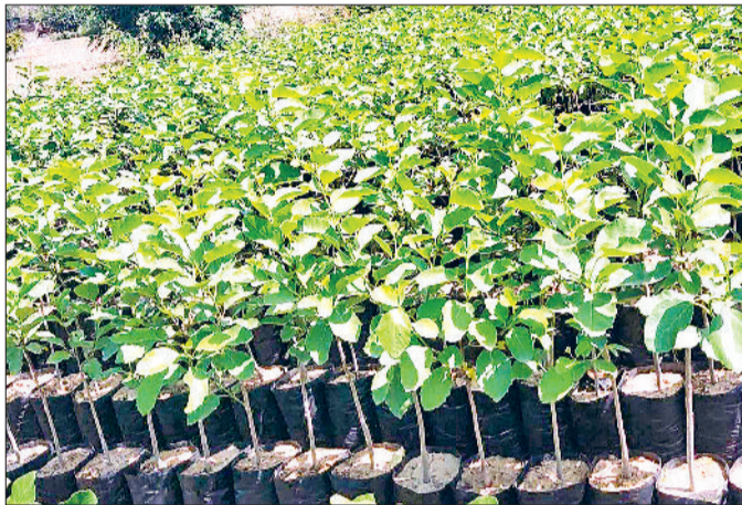
नारनौल। वन विभाग की नर्सरी में तैयार की जा रही पौध।

वन विभाग की इस पहल से न केवल वनों का विस्तार होगा, बल्कि इससे भूमि की गुणवत्ता में भी सुधार होगा। पौधारोपण से वातावरण में ऑक्सीजन की मात्रा बढ़ेगी और प्रदूषण कम होगा, जिससे लोगों के स्वास्थ्य पर सकारात्मक प्रभाव पड़ेगा। पेड़-पौधे बरसात में भी मददगार होते हैं और बरसात की इस समृद्ध झलाके को अब सख्त जरूरत पड़ने