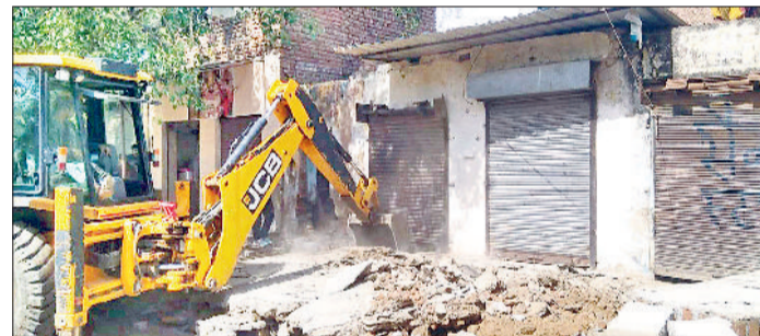
महेंद्रगढ़। पक्के चबूतरों तोड़ती जेसीबी मशीन व पुलिसकर्मी के हाथ जोड़ती महिला।