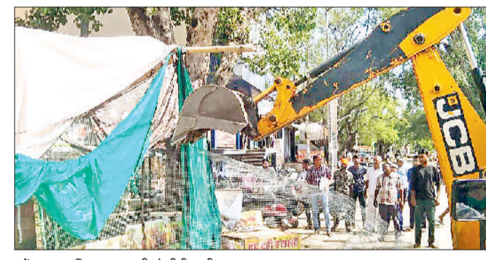
महेंद्रगढ़। अतिक्रमण हटाती जेसीबी मशीन।

सबसे छोटा रास्ता है। इस मार्ग पर मसानी चौक, पाठशाला रोड, परशुराम चौक, बास मोहल्ला, सैनीपुरा, गुर्जरों की ढाणी में हजारों की संख्या में लोग रहते हैं। टूटी सड़क के कारण लोगों को परेशानियों का सामना करना पड़ रहा था। इस मार्ग पर पांच-छह फीट की दूरी पर गहरे गड्ढे बने हुए हैं। जाम के कारण बाजार में आने वाले ग्राहकों को भारी परेशानी उठानी पड़ती है। दो किलोमीटर लंबे इस मार्ग का सफर तय करने में वाहनों का आधे घंटे का समय लग जाता है। अतिक्रमण हटने के बाद राहगीरों को आवागमन में काफी सुविधा होगी।